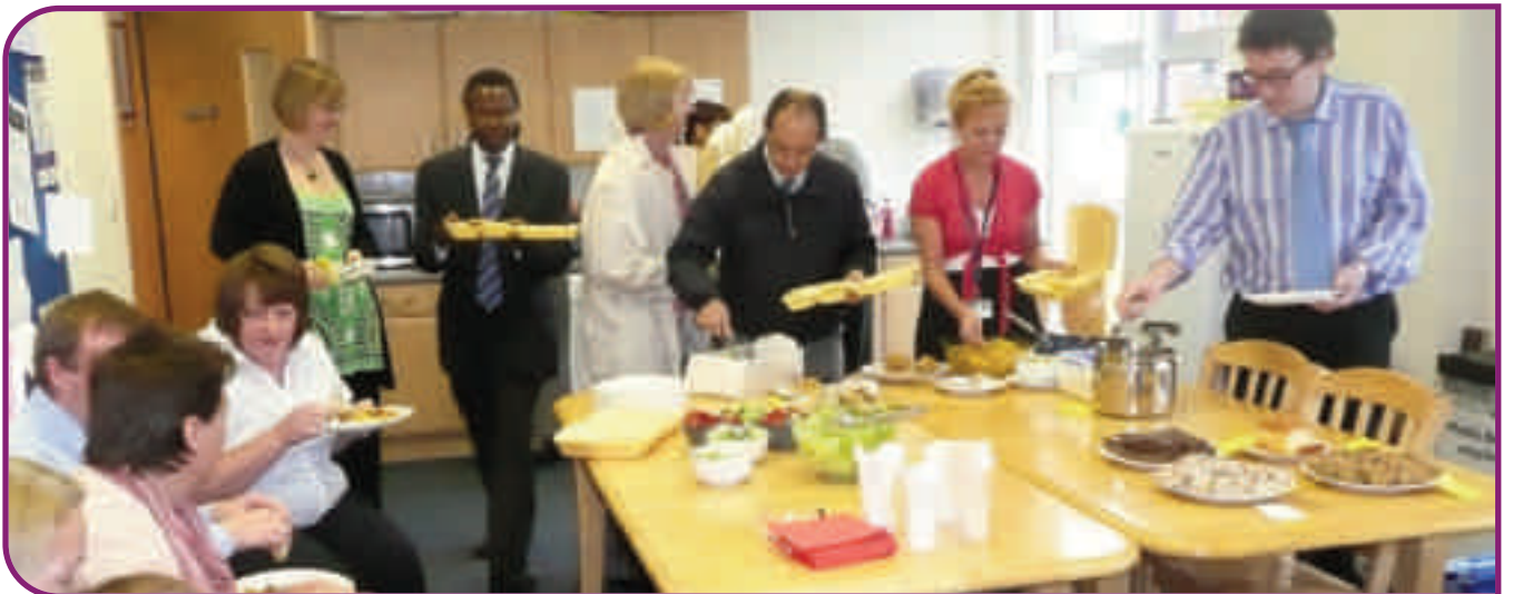
سیلاب زدگان کی امداد کے لیے فنڈ اکٹھا کرنے کا دن

اس طرح اکٹھی کی گئی رقم گلاسگو میں قائم ایک سکائش رفاہی تنظیم یوکیسز فاؤنڈیشن کو عطیہ کی گئی ہے جو پاکستان کے