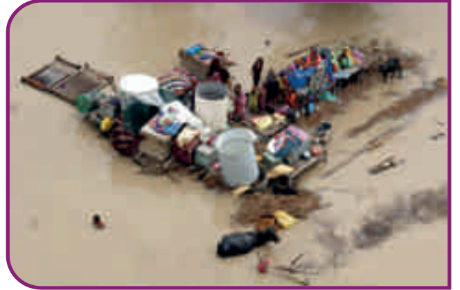
پاکستان میں سیلاب کی تباہ کاریاں

سیلاب میں بے گھر ہونے والے لوگوں کے لیے 700 مکانات تعمیر کرنے کا ارادہ رکھتی ہے۔