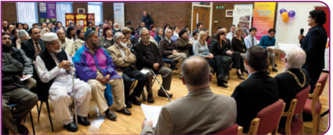
تقریب میں تقریریں پوری ہیں