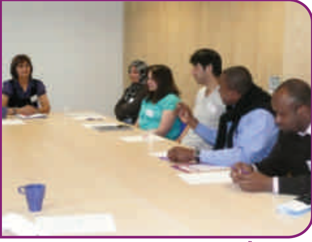
ملازمت کے مواقع کے بارے میں ہونے والے مذاکرے کے شرکاء

اس پراجیکٹ کے تحت 120 افراد کا جائزہ لیا گیا ہے اور انہیں مدد فراہم کی گئی ہے اور 25 افراد نے اس پراجیکٹ کے ذریعے ملازمت حاصل کی ہے۔ اس پراجیکٹ میں جو لوگ آئے ہیں ان میں سے کچھ لوگوں کو براہ راست مختلف تنظیموں کی طرف سے بھیجا گیا ہے، کچھ دوسرے لوگوں کی وساطت آئے ہیں اور کچھ لوگ خود ہی یہاں آئے ہیں۔ اب تک لوڈین اینڈ بارڈرز پولیس، لنک لونگ، پینور (سکاٹ لینڈ) اور دیگر مختلف تنظیموں کے ساتھ نومزید پلیسمنٹس کا انتظام کیا جا چکا ہے۔ مختلف آجروں کے ساتھ مزید پلیسمنٹس کا انتظام کیا گیا ہے تاکہ ملازمت کے راستے میں حائل رکاوٹوں کو دور کیا جاسکے اور ملازمت کے مواقع پیدا کیے جاسکیں۔